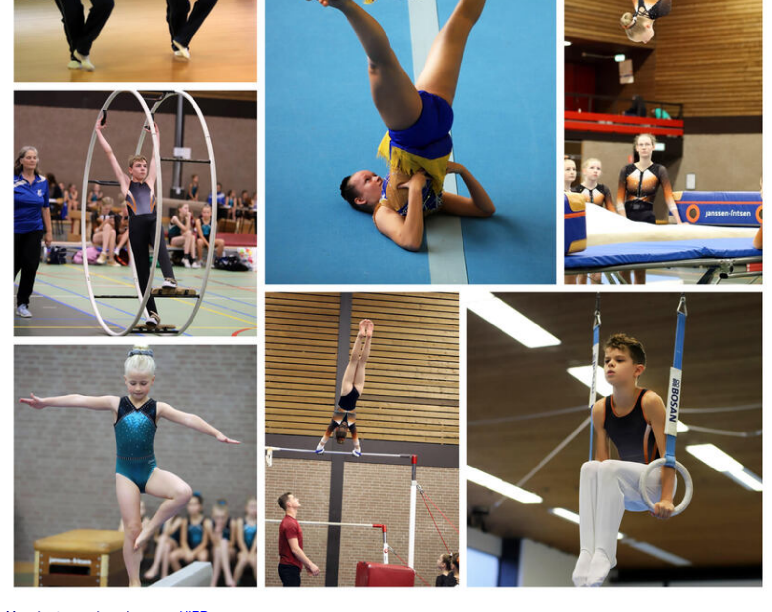
Meer foto's van deze dag staan HIER